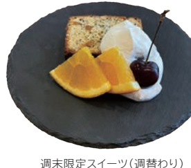
週末限定スイーツ(週替わり)

SHOP INFO. 浜松市中央区砂山町1111 TEL 053-453-0332(酒屋) 053-489-3231(珈琲店) 営業時間 / 9:00~18:00(珈琲店は17:30まで) 定休日 / 水・木曜日